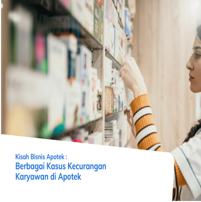
Kisah Bisnis Apotek : Berbagai Kasus Kecurangan Karyawan di Apotek